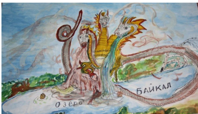
Плакат скаутов «Маугли» г. Энгельса

Лучшие "взрослые работы" уже опубликованы в журнале "Вожатый"!